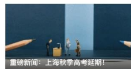
重磅新闻：上海秋季高考延期！